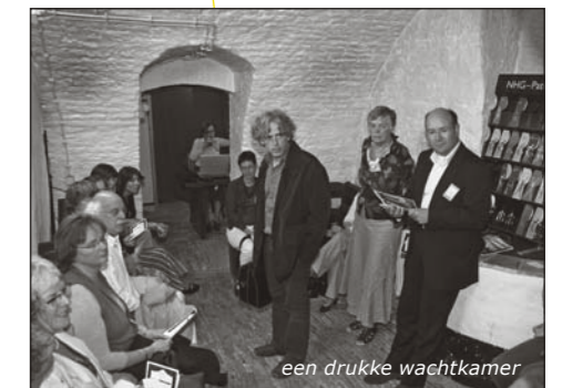
een drukke wachtkamer

humoristische als tragische wijze uit hoe het eraan toe kan gaan in een drukke wachtkamer. Hoe is de interactie tussen patiënten onderling en hoe ervaart de huisarts dit?